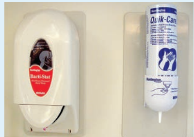
抗菌 (藥用) 肥皂